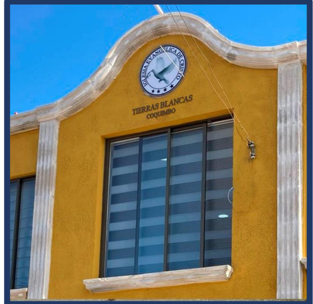
Tierras Blancas, Coquimbo: Letrero actual, simulación de estrellas y leyenda de localidad.