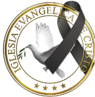
Formato para luto