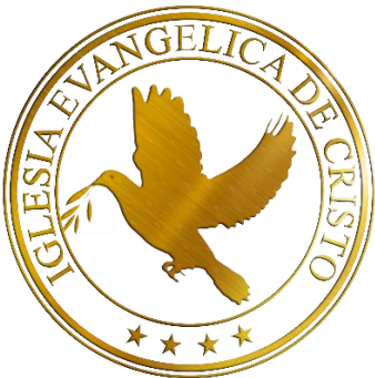
Textura dorada (simulación)