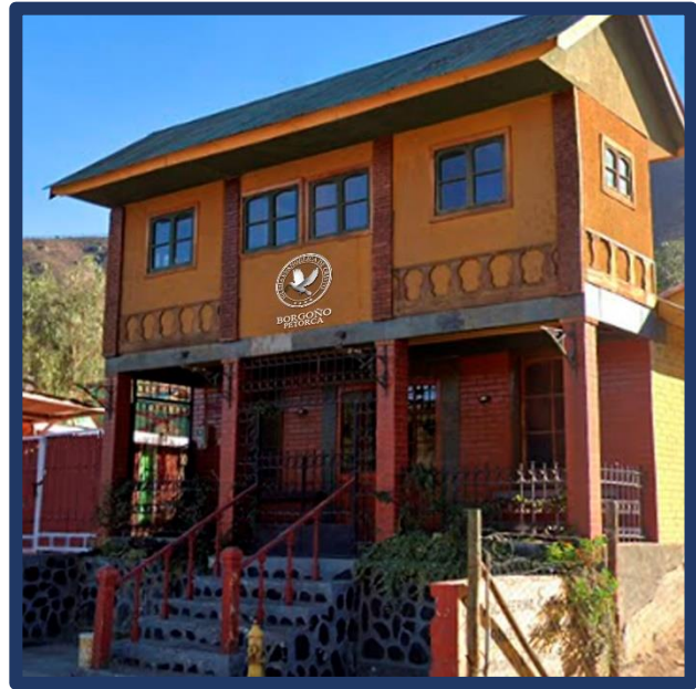
Borgoño, Petorca: Simulación de letrero y leyenda de localidad.