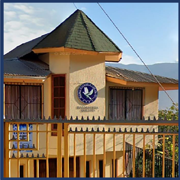
Balmaceda, Quillota: Letrero actual, simulación de leyenda de localidad.