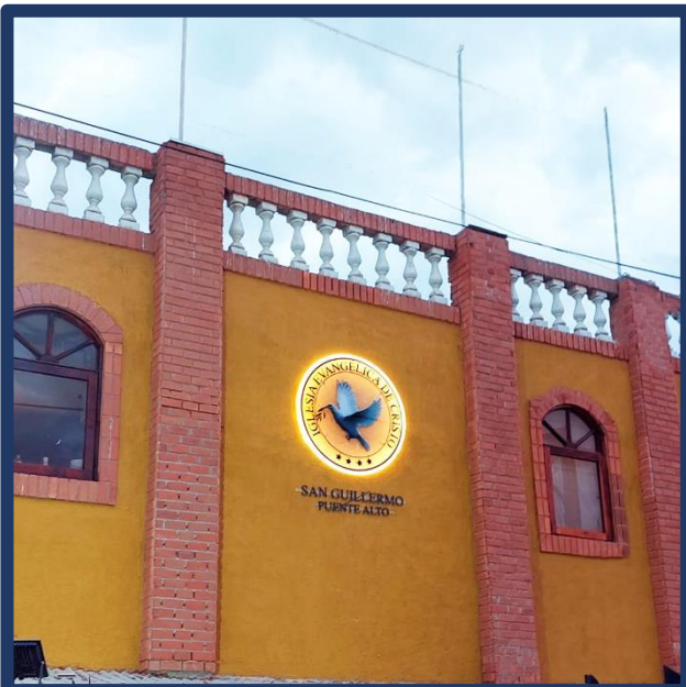
San Guillermo, Puente Alto: Letrero y leyenda de localidad actuales.