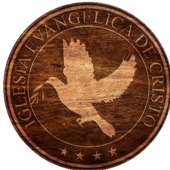
Textura madera (simulación)